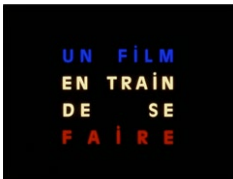
« Un film en train de se faire », La Chinoise , Jean-Luc Godard, 1967, France

DU MERCREDI AU DIMANCHE DE 10H30 À 18H JEUDI 30 JANVIER 2025 À 19H