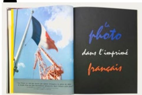
Caractère Noël 1954, hors-série dédié à la photographie, dirigé par Maximilien Vox, Paris, Union syndicale et fédération des syndicats des maîtres imprimeurs de France, 1954, collection MICG