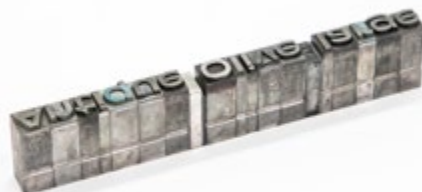
Roger Excoffon, Antique Olive, caractères en plomb, collections MICG