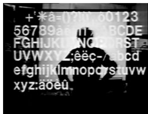
Surimpression en Helvetica, film essai Scénario du film Passion , Jean-Luc Godard, 1982, Suisse