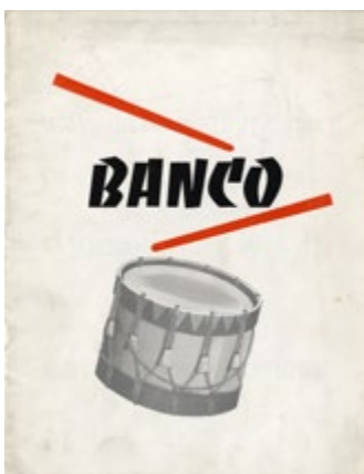
Roger Excoffon, Banco, Fonderie Olive, 1951, Marseille, MICG, sdd 244