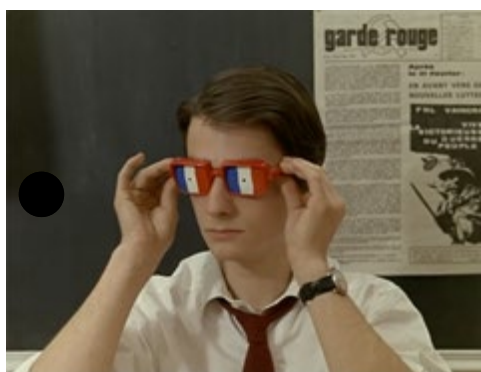
Jean-Pierre Léaud, dans La Chinoise , Jean-Luc Godard, 1967, France